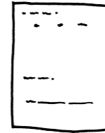
แบบฟอร์ม คำร้องขอ 願書

をびや許し、お守り、別席、おさづけの理拝戴を希望される方は、次のものをご用意ください。 (* 詰所の方は必要なものを指差してお伝えください。)