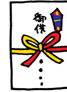
เงินถวายที่โบสถ์ศูนย์กลาง เงินถวายที่โบสถ์ใหญ่ เงินถวายที่หอพัก 本部御供 直属教会御供 詰所御供