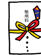
ค่าธรรมเนียม ในการคำร้องขอ 幣帛料